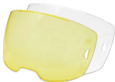
Visières frontales à lentille HD