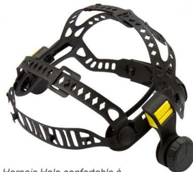
Harnais Halo confortable à cinq points de réglage (vue de face)