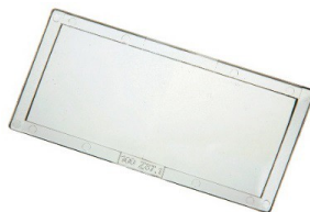
Lentille de grossissement dioptrique