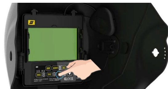
Filter à teinte variable automatique (ADF) avec interface d'écran tactile couleur